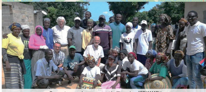
Rencontre avec la communauté villageoise d'EDIAMATH