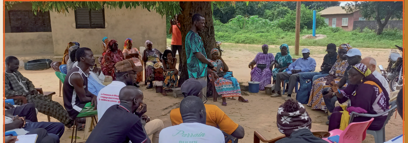
Sous l'arbre à palabre, réunion de travail avec la communauté d'Ediamath.

Faisant suite aux études géophysiques réalisées durant le 1 er trimestre, la mission d'octobre 2024 a préparé la seconde phase active sur le terrain et ce, dans plusieurs axes, à savoir :