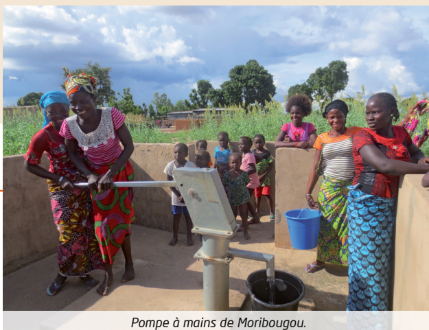
Pompe à mains de Moribougou.

Merci d'être à nos côtés pour faire de ces objectifs une réalité durable.