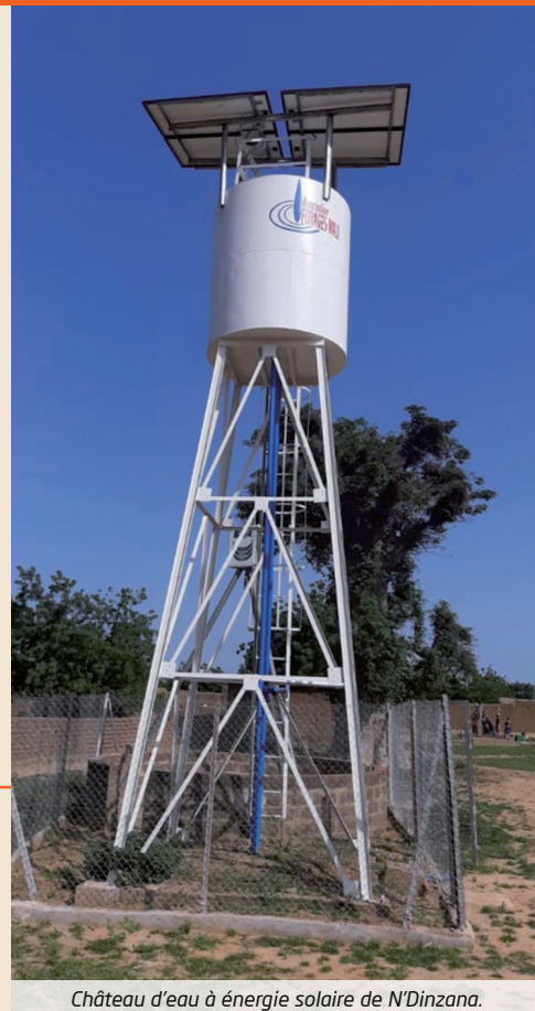
Château d'eau à énergie solaire de N'Dinzana.