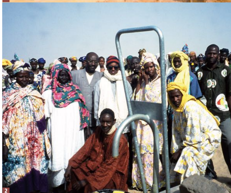
1 Premières mesures du débit au cours du forage. 2 Boli : les responsables du point d'eau au premier plan.

mation. C'est grâce à elle que seront évitées les erreurs de « casting », les doublons et des difficultés de gestion postérieures. À ce jour, la Cash-NEF a déjà réalisé une cinquantaine de monographies dans trois communes et la liste des informations référencées s'est encore allongée (1).