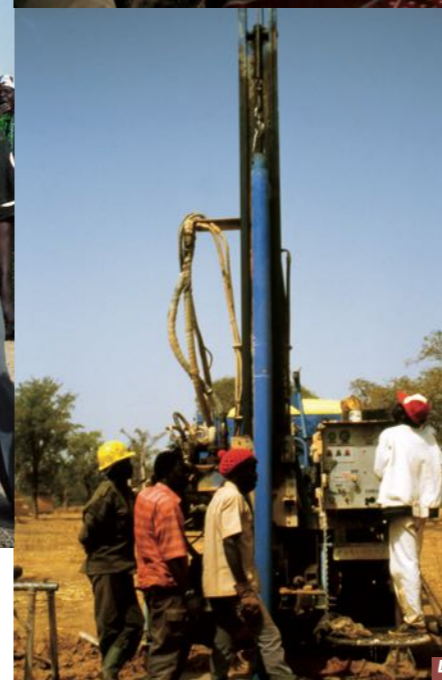
3 Réunion avec le conseil municipal et les villageois. 4 La foreuse en action.

groses réparations, il faudra faire appel à un spécialiste à Douentza. La caisse de l'eau doit permettre d'anticiper le changement de pompe, qui ne manquera pas d'intervenir d'ici cinq ou dix ans, selon les caractéristiques hydrogéologiques du forage (l'eau ferrugineuse attaque davantage les pompes).