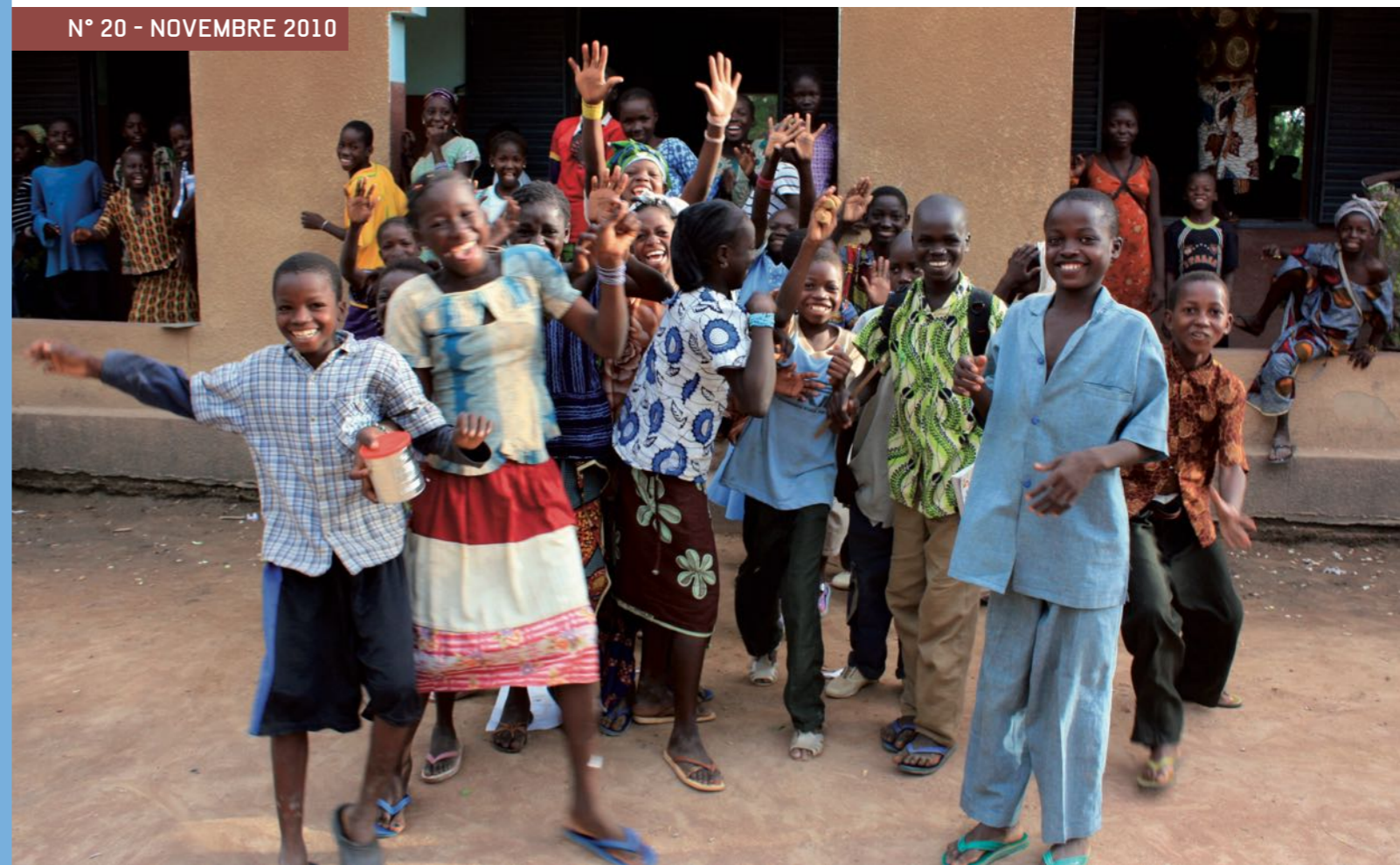
L'école de Koloningé (région de Koulikoro). L'éducation est une priorité pour le développement du Mali. Aujourd'hui, 64 % des garçons et seulement 4 % des filles vont à l'école, alors qu'ils n'étaient que 5 % - filles et garçons confondus - en 1960.